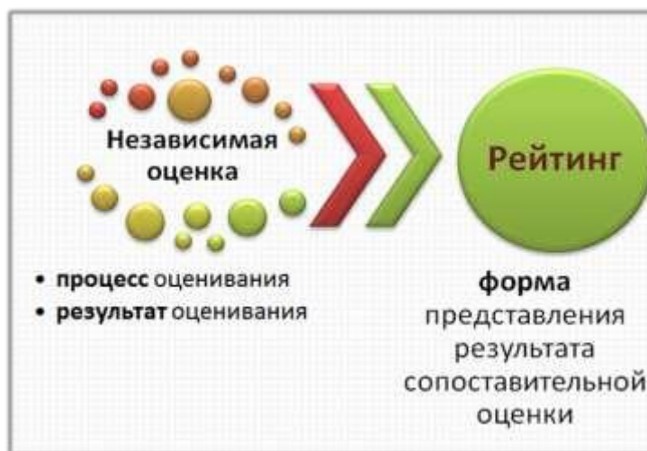
Рисунок 5. Схема формирования рейтинга в процессе проведения оценки

соблазн выстроить эти школы по порядку: от лучших – к худшим. Так возникает рейтинг.