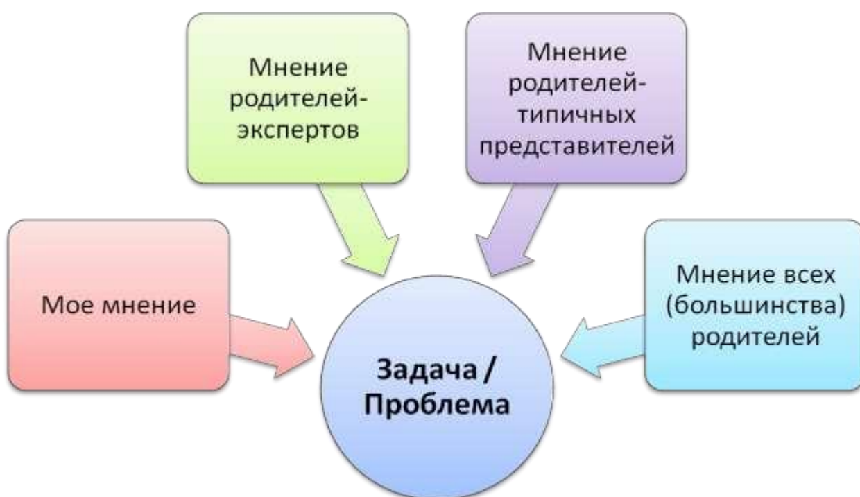
Рисунок 2. Модель выявления проблемы или задачи развития образовательной организации методом расширения круга заинтересованных субъектов.

Начать эту работу можно с формулировок проблем, актуальных для основных инициаторов данной работы (рис. 2).